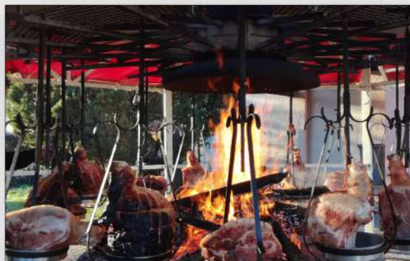
manège à jambon