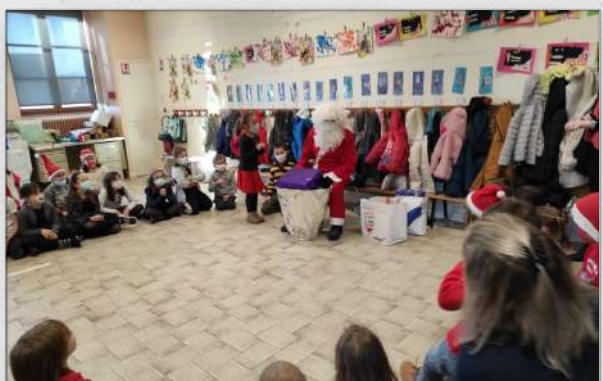
Noël à l'école - cadeaux offerts aux enfants par Le Chemin des écoliers