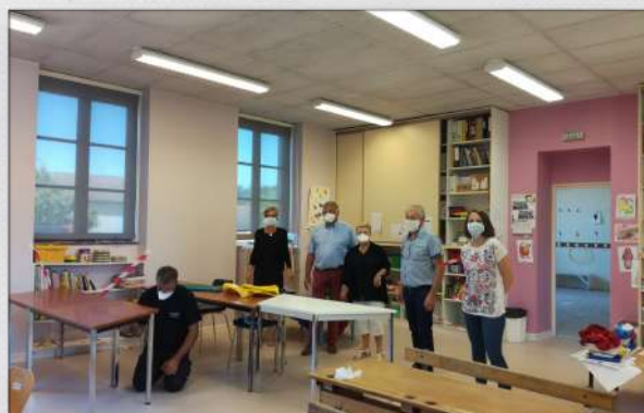
Préparation de l'école au protocole sanitaire