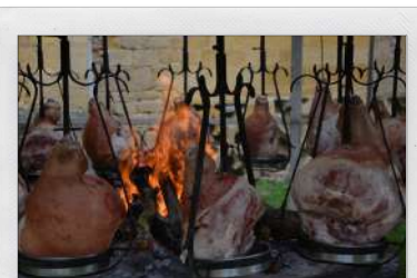
Manège à jambon - Festibaye

Samedi 8 mai : Commémoration au monument aux morts