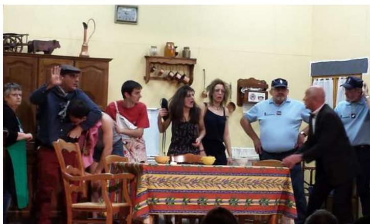
Soirée Théâtre organisée par l'Amicale des Burlesques - Mars 2017